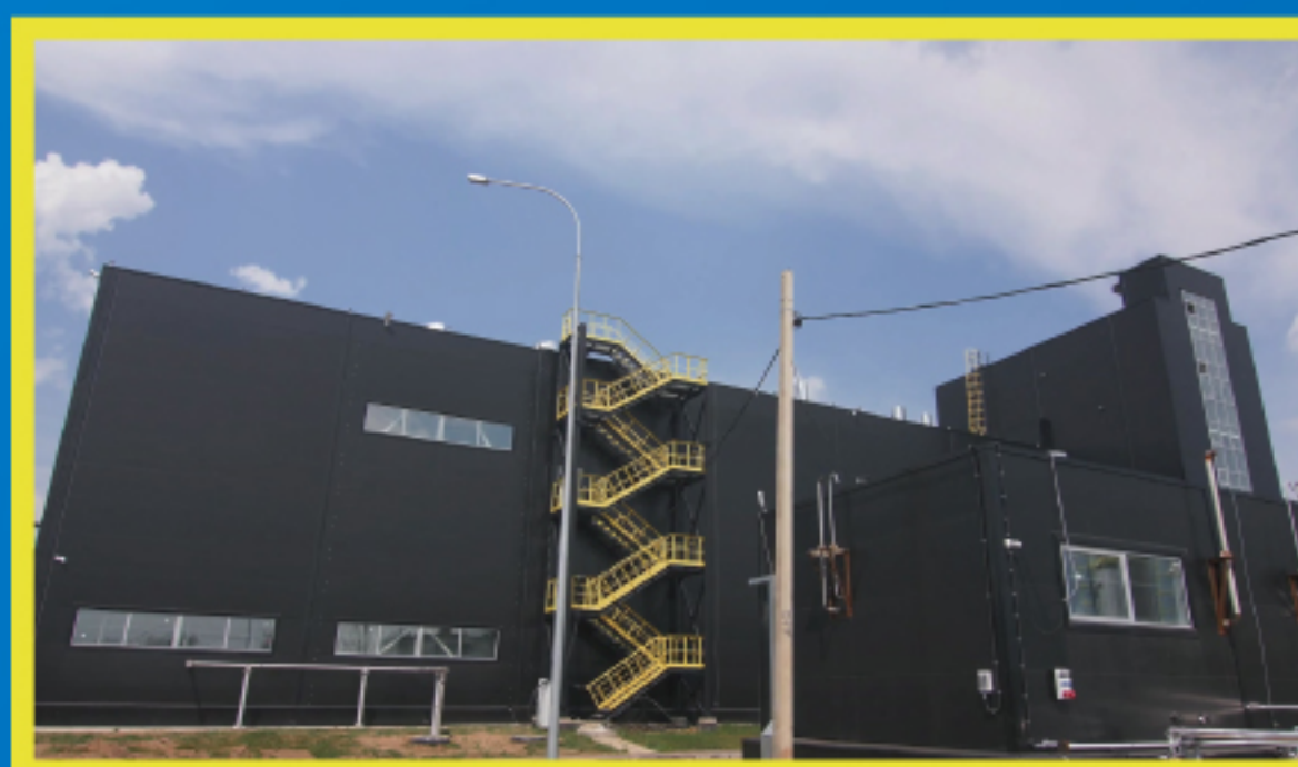
新工場 ※画像はイメージ