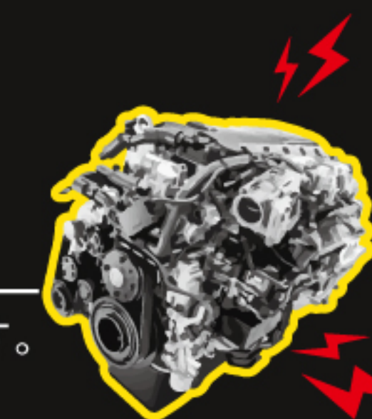
コモンレール対応 内容量: 200ml

インジェクターとエンジン内部の汚れ(デポジット)を徹底除去します。エンジン内部の燃焼効率上がり、振動も減少します。